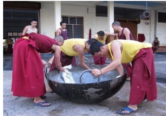
Monniken van het Tsawa Khangsten. Normaal worden de maaltijden hier in de centrale kloosterkeuken bereid