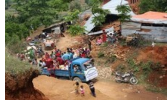
Actie corona lockdown-voedselhulp voor dagloners in Nepal, uitgevoerd door monniken van het Kopan klooster

-Corona lockdown-actie met voedselhulp voor dagloners in Zuid-India, uitgevoerd door monniken van het Gaden Jangtse klooster, mei 2020. Opbrengst ca E 1.500,--