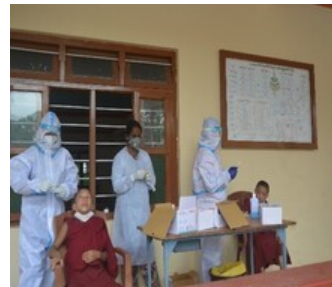
Actie voor de corona-uitbraak in het Gaden Jangtse klooster en de Tibetaanse dorpen

-Corona lockdown-actie voor dagloners in Bihar. Op kosten van de Tara stichting werden voor E 2.500,-- dekens uitgereikt aan de allerarmsten in en rond Bodhgaya, door Sangha en staf van het Root Institute. (elk jaar sterven veel arme mensen in Bihar door de kou)