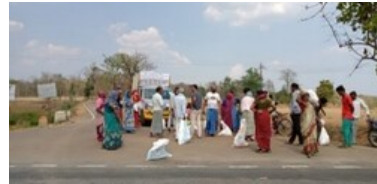
Actie corona lockdown-voedselhulp voor dagloners in Zuid-India, uitgevoerd door monniken van het Gaden Jangtse klooster

-Corona hulp-actie, voor monniken en leken-Tibetanen, bij ernstige corona uitbraak in Gaden Jangtse klooster en omgeving in oktober/november 2020. Opbrengst bijna E 9.000,--: voor Tsawa Khangsten, dat 70 besmette monniken had.; voor het kloosterziekenhuis; voor het Covid-19 ziekenhuis in Camp 3, en voor drie ademhalings-apparaten voor het kloosterziekenhuis en voor het Covid-19 ziekenhuis.