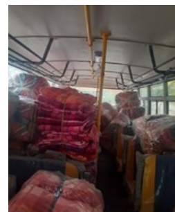
Actie corona lockdown-2500 dekens voor dagloners in Bihar, uitgevoerd door Sangha en staf Root Institute.

Deze vier corona noodhulp-acties brachten bijna E 18.500,-- op!